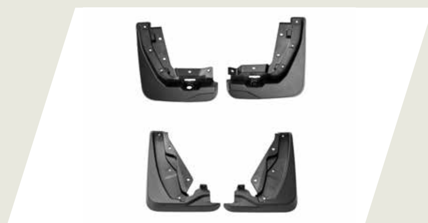
JUEGO DE BARREROS DELANTEROS Y TRASEROS CÓD. 50290576