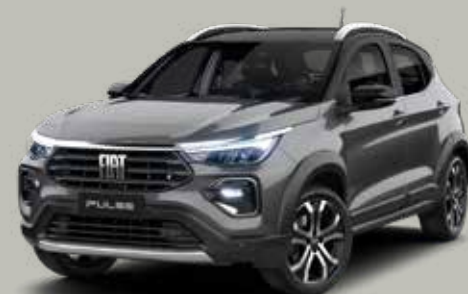
175 - GRIS SILVERSTONE