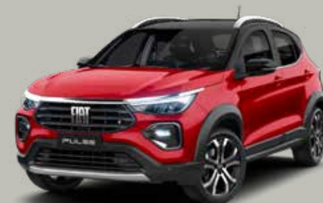
663 - ROJO MONTECARLO