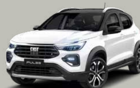
743 - BLANCO BANCHISA