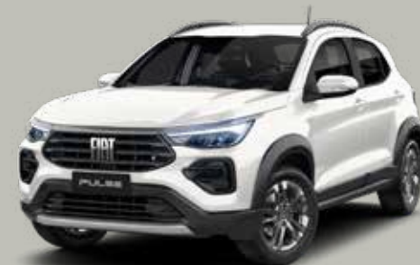
249 - BLANCO BANCHISA