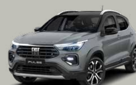
766 - GRIS STRATO