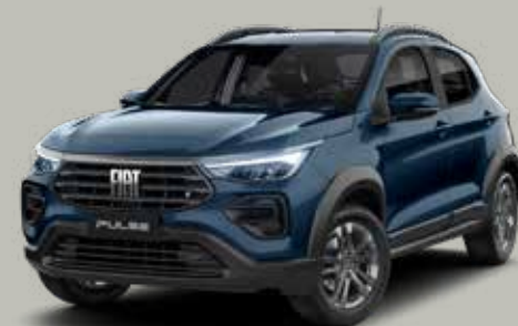
200 - AZUL AMALFI