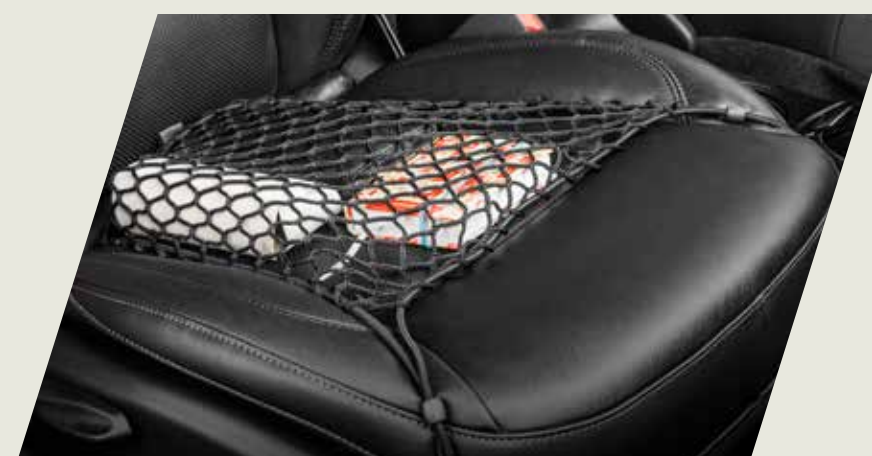
RED ELÁSTICA DE ASIENTO DELANTERO CÓD. 50927606