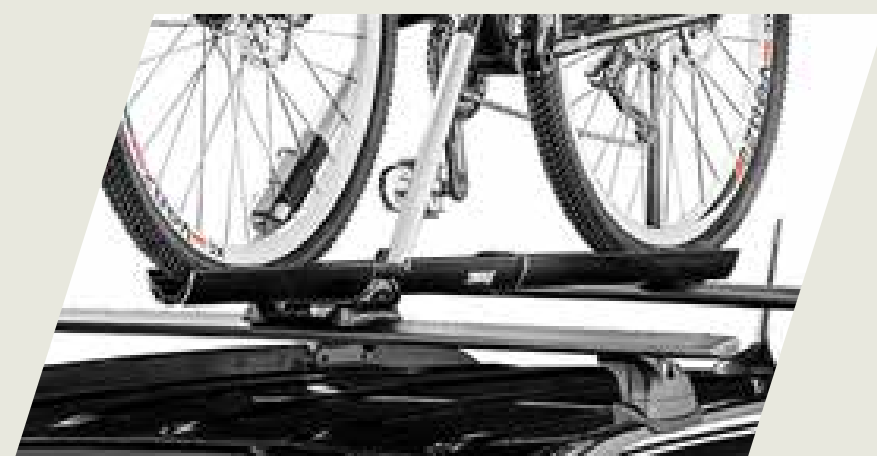
SOPORTE DE BICICLETA PARA TECHO CÓD. 50928310