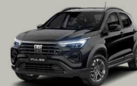
806 - NEGRO VULCANO