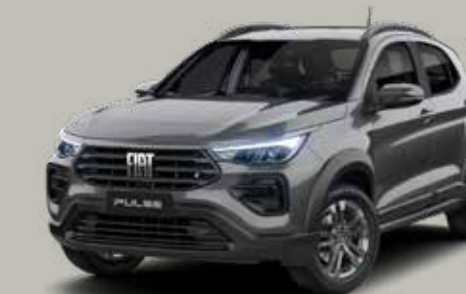
979 - GRIS SILVERSTONE