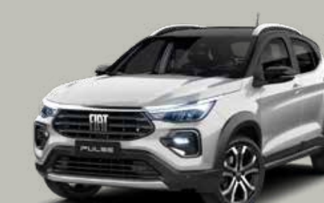
832 - PLATA BARI