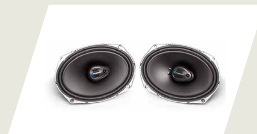
KIT PARLANTES DELANTEROS CÓD. 50928230