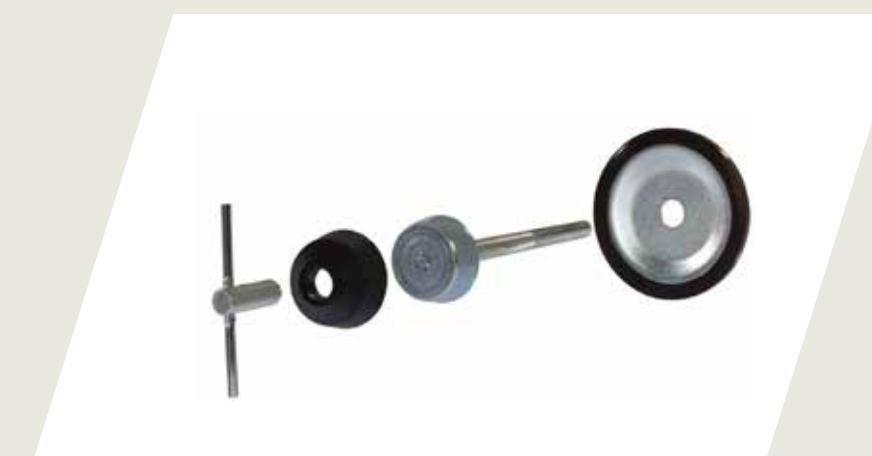
BULÓN DE SEGURIDAD PARA RUEDA DE AUXILIO CÓD. 50928093