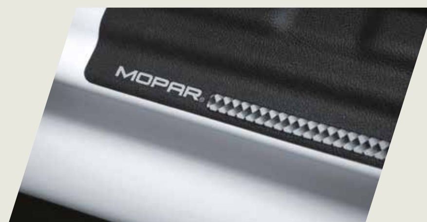
PROTECTOR VANO PUERTA VINILICO MOPAR CÓD. 50928105

Acercate a un concesionario y conocé la gama de accesorios originales que mopar te ofrece para equipar tu Fiat Pulse", seguido de las imágenes de cada accesorio.