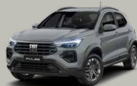
540 - GRIS STRATO