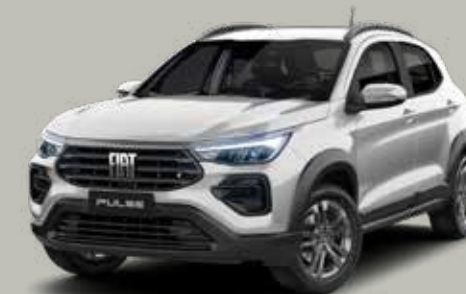
619 - PLATA BARI