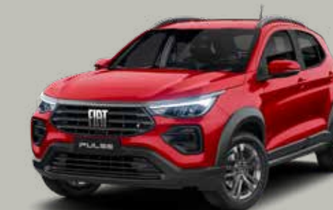
978 - ROJO MONTECARLO