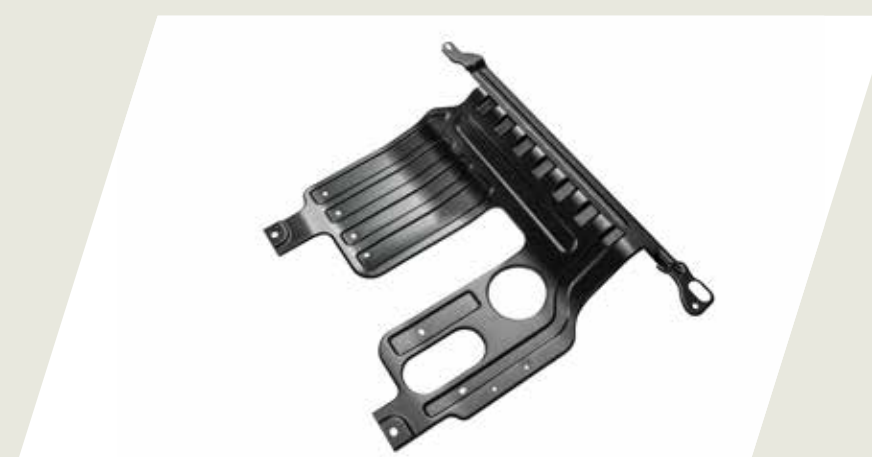
CUBRECARTER CÓD. 50290245