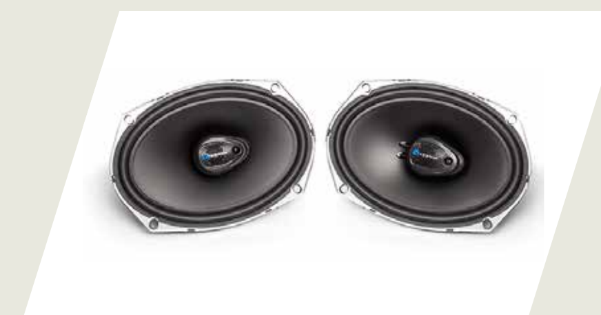
KIT PARLANTES TRASEROS CÓD. 50928457