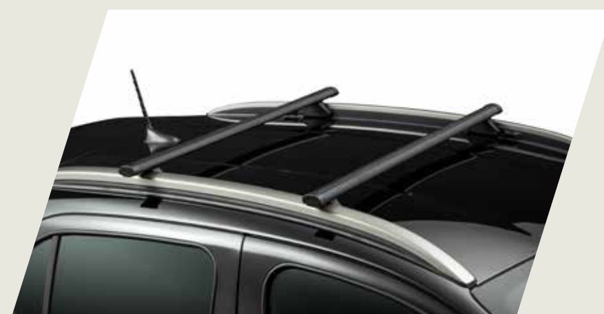
BARRA TRANSVERSAL DE TECHO CÓD. 50040107