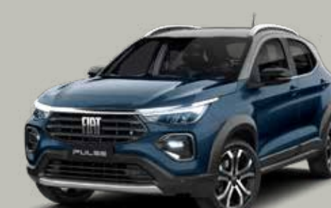
782 - AZUL AMALFI