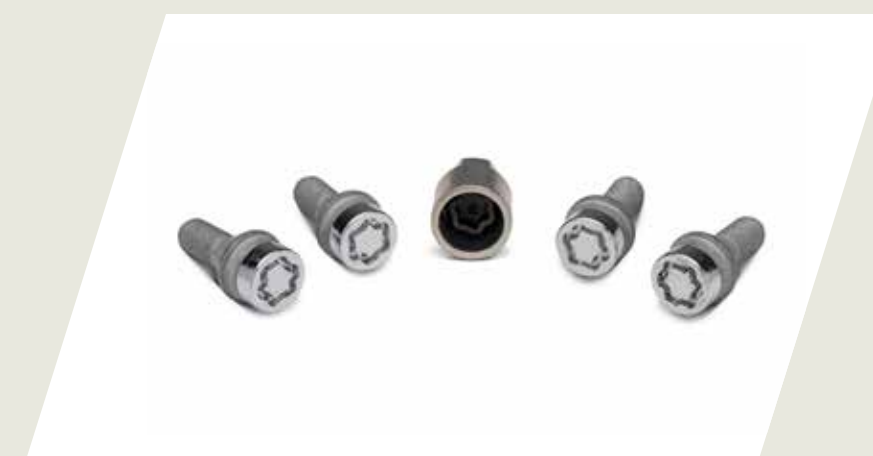
JUEGO DE TORNILLOS ANTIROBOS PARA RUEDA CÓD. 50902050